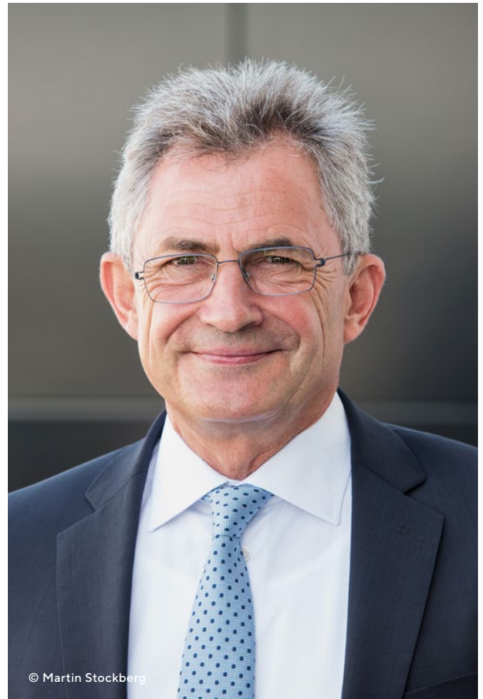
Dipl.-Ing. Peter Hübner Präsident des Hauptverbandes der Deutschen Bauindustrie

Seit der Erstauflage von Bauen statt Streiten im Sommer 2018 hat sich die Notwendigkeit eines flächendeckenden Einsatzes von Partnerschaftsmodellen weiter erhöht. In dieser zweiten, aktualisierten Auflage stellen wir nicht nur neue Referenzprojekte vor, sondern zeigen unter anderem auf, wie wir durch integrale Planungsprozesse effizienter werden, welche Chancen sich daraus für mehr Nachhaltigkeit bieten und welche Rolle BIM dabei spielt.